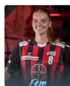
FEM Boeters KM Niederlande 17.03.02